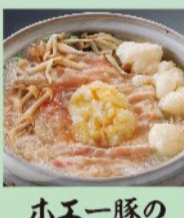
ホエー豚のみぞれ鍋