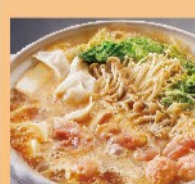
鶏味噌ちゃんこ鍋