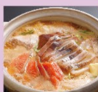
サーモンの石狩鍋