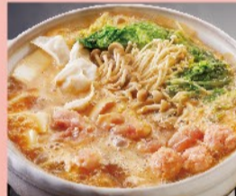
鶏味噌ちゃんこ鍋