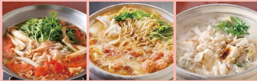
ホエー豚のトマト鍋 鶏味噌ちゃんこ鍋 ホエー豚の和風みぞれ鍋