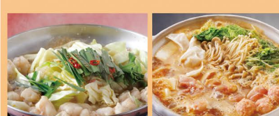
国産牛もつ鍋 鶏味噌ちゃんこ鍋