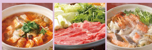
海鮮とあさりのスンドゥブ鍋 牛すき焼き鍋 海鮮寄せ鍋